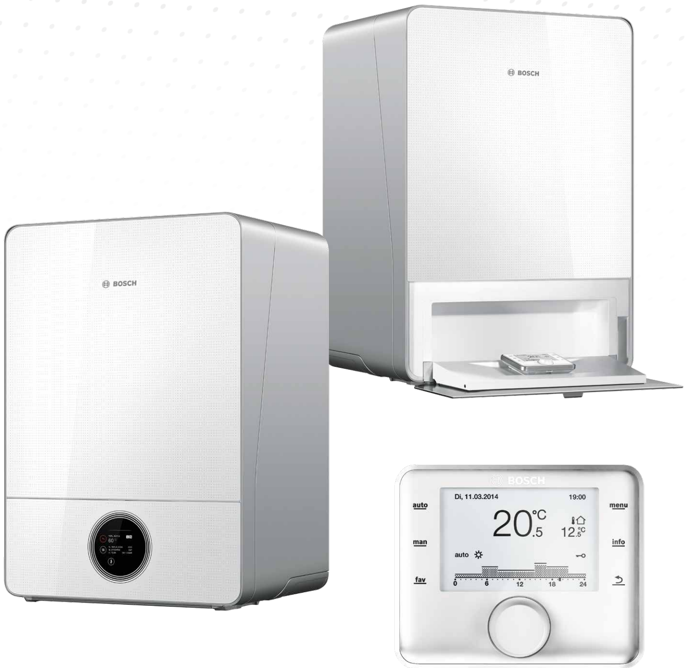
Ekvitermní regulátor CW400